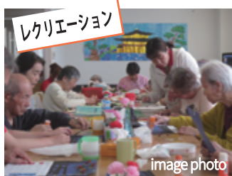
レクリエーション

御本人様・御家族様の想いに寄り添い、家庭的な雰囲気の中で生活を送って頂ける様に支援します。サービス付き高齢者住宅・入浴特化型デイサービスと併設しており必要に応じたサービスを選択して頂けます。